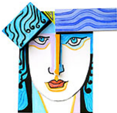
Compreensão e Percepção

Acrílico sobre madeira em planos superpostos 2008 – 0,46m x 0,36m x 0,05m