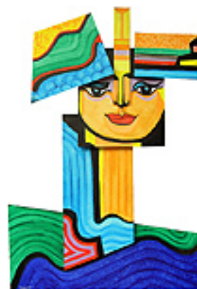
CAPA: Mulher com Chapéu indo a uma Festa

Acrílico sobre madeira em planos superpostos 2008 – 0,45m x 0,47m x 0,05m