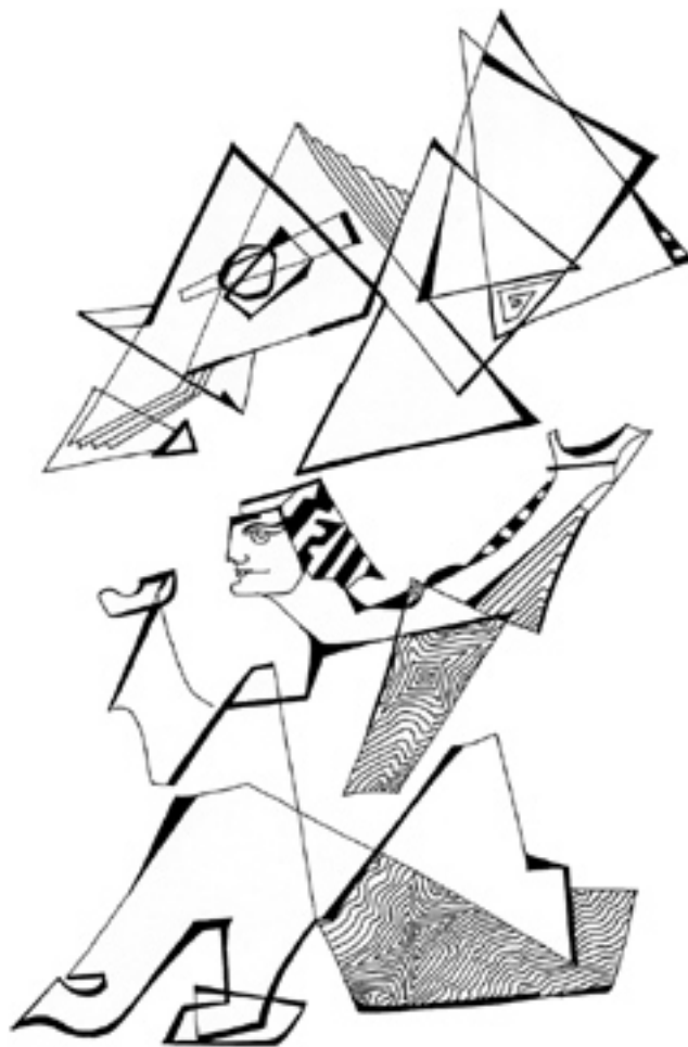
Holoassy: Texto e ilustração em nanquim para o livro "O Viajante Espiritual". Edição do artista.

E que viver, por si só, é o maior dos gestos de criação.