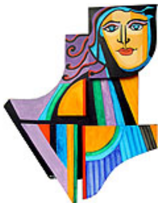
A Alma do Pássaro

Acrílico sobre tela sobre alumínio em planos superpostos 2008 – 0,67m x 0,53m x 0,05m